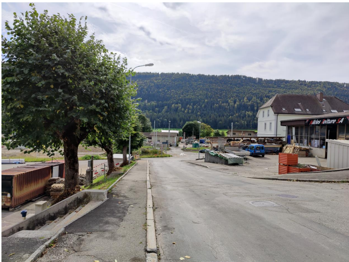
La Rue de Chasseral avant le début des travaux.

Le quartier situé à l'est de la gare de Saint-Imier s'apprête à vivre de profondes transformations. Le gros des travaux démarrera tout bientôt.